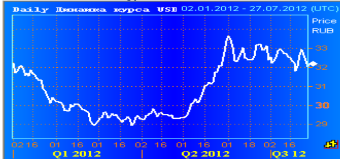
динамика курса USD/RUB с начала года